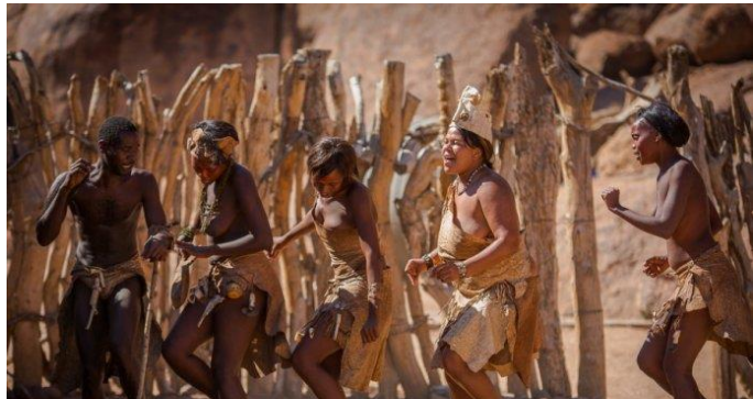
载歌载舞的非洲人

年却在遭受着病痛的折磨。疾病以及贫穷阻挡了孩子们求学的脚步，而那些幸运地踏入校园的孩子们，也因为资金不足，无法享受音乐带来的乐趣。我们选择尽自己所能，用音乐为马拉维的青少年带来快乐，带来文化，带来梦想。