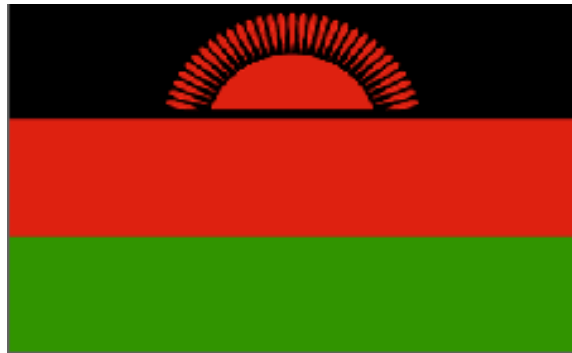
马拉维共和国国旗